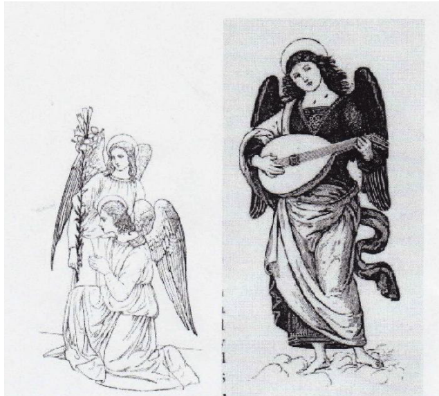
Above pictures of Angels