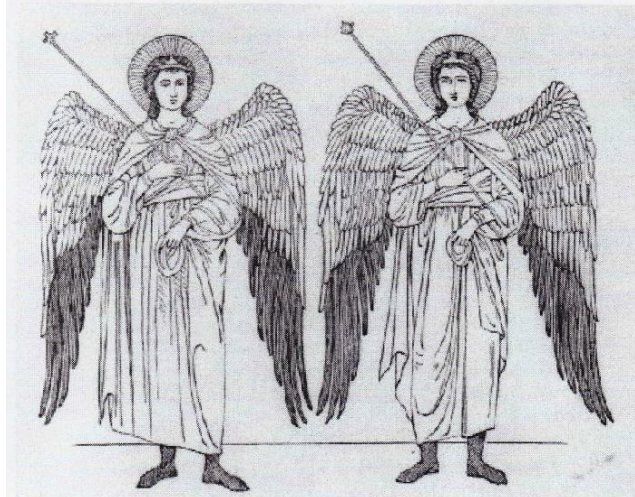
Above picture of Archangels